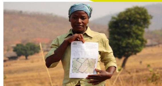
Une femme tenant son certificat foncier en Zambie rurale.